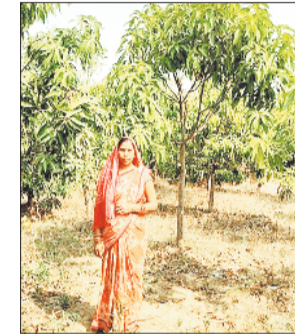
पौधरोपण कार्य का सफल क्रियान्वयन किया गया। कुल 1.70 लाख रुपए की लागत से मजदूरी मद 1.18 लाख एवं सामग्री मद 0.52 लाखक यह कार्य 31 जुलाई 2020 को प्रारंभ होकर 31 अगस्त 2022 को पूर्ण हुआ। इस दौरान 707 मानव दिवस का सृजन हुआ जिससे गांव के कई अकुशल श्रमिकों को निरंतर रोजगार मिला। लगातार तीन वर्षों से इस योजना के तहत मैटेनंस किया गया।

महात्मा गांधी राष्ट्रीय ग्रामीण रोजगार गारंटी योजना मनरेगा अब केवल मजदूरी तक सीमित नहीं रही, बल्कि ग्रामीण क्षेत्रों में पर्यावरण संरक्षण और आत्मनिर्भर आजीविका का मजबूत माध्यम बनती जा रही है। रायगढ़ जिले के तमनार विकासखंड अंतर्गत ग्राम पंचायत बिजना में मनरेगा के तहत किए गए पौधरोपण कार्य ने बंजर भूमि को हरियाली में बदलते हुए ग्रामीणों के जीवन में सकारात्मक बदलाव की नई कहानी लिखी है।