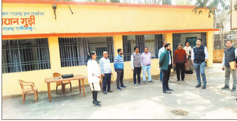
निरीक्षण करने पहुंचे कलेक्टर।

साथ ही आवश्यक सामग्री, सुविधाओं एवं सेवाओं की निरंतर पूर्ति सुनिश्चित करने पर विशेष जोर दिया गया। निरीक्षण के दौरान कलेक्टर ने संबंधित अधिकारियों को निर्देशित