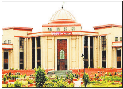
2021 में पारित मुआवजा आदेश की समीक्षा करने से पूर्व छत्तीसगढ़ भूमि राजस्व संहिता की धारा 51

इसी के आधार पर कलेक्टर द्वारा 25 जुलाई 2024 को अनुविभागीय अधिकारी राजस्व घरघोड़ा को पत्र जारी कर मुआवजा राशि का पुनः आकलन करने के निर्देश दिए गए। इसके पश्चात् एसडीओ राजस्व द्वारा 2 दिसंबर 2024 को आदेश पारित कर पूर्व में निर्धारित मुआवजा राशि में कटौती कर दी गई। याचिकाकर्ता को ओर से यह तर्क दिया गया कि वर्ष